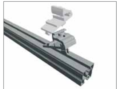
1 Seitlich einhaken und drehen.