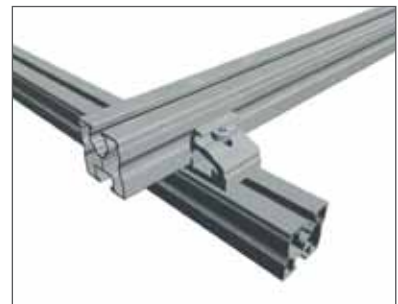
3 Profil auflegen und von oben festschrauben.

Der Rapid Kreuzverbinder (Art.Nr. 129063-000) ist im Gegensatz zu seinem Vorgänger komplett vormontiert. Dadurch wurden die Montageschritte auf ein Minimum reduziert.