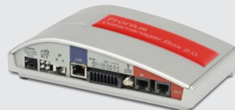
/ Fronius Datamanager Box 2.0

/ Komfortabler Support da der Fronius Datamanager den Wechselrichter direkt mit Fronius Solar.web verbindet.