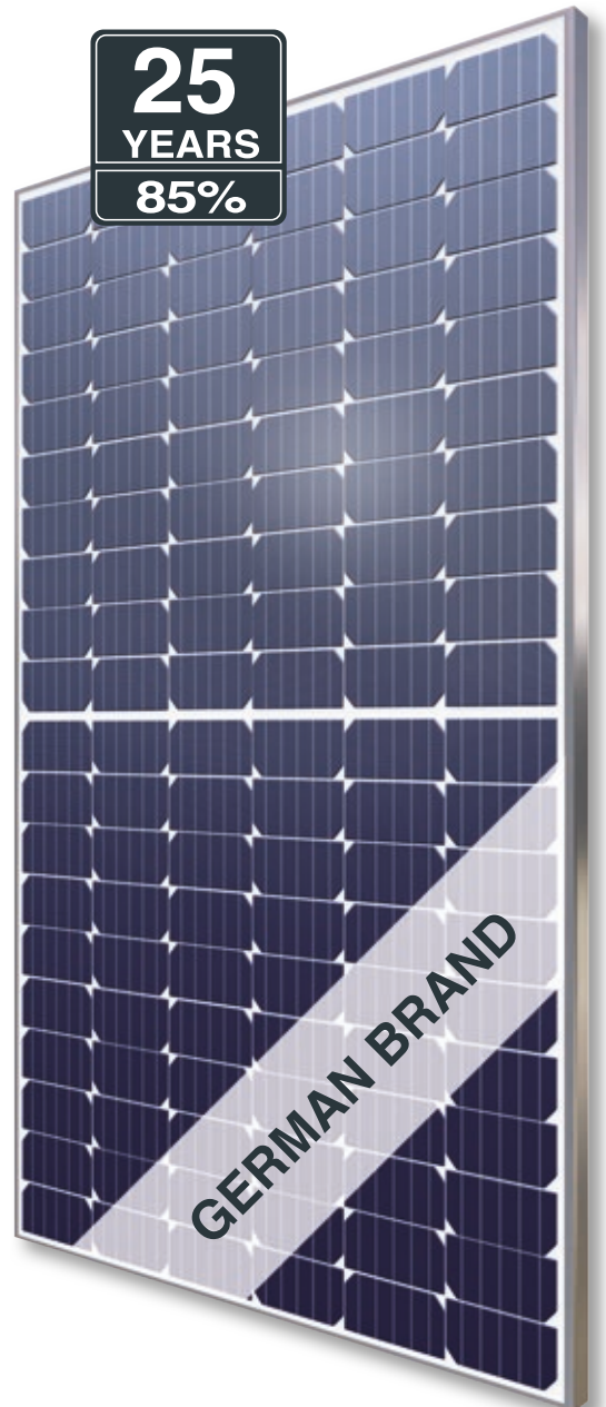
Abb. ähnlich 120MHDE210629A